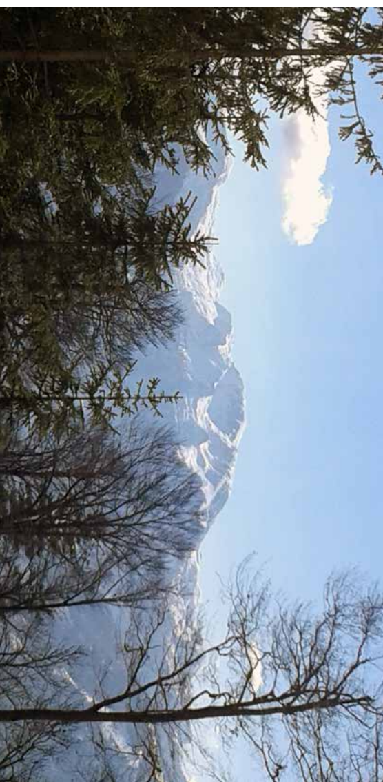
Blick vom Feuerkogel Richtung Hochkogelhaus, Schöbberg und Rauherkogeln