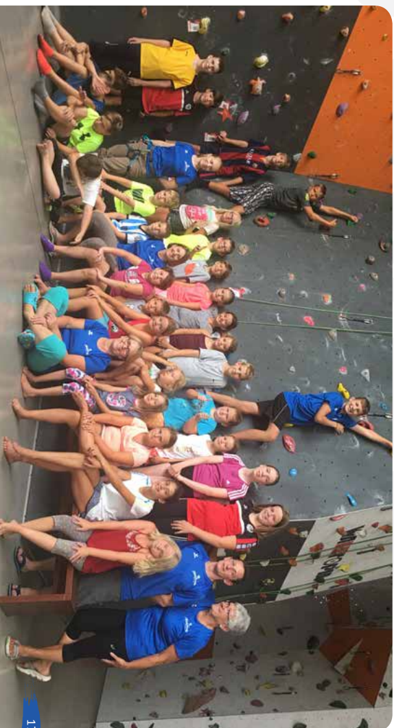
Die Ferienpass Gruppe Klettern