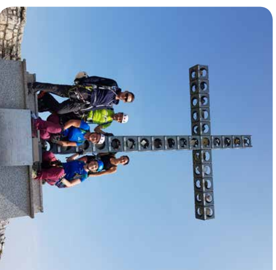
HTL Klettersteig der Naturfreunde am Feuerkogel

Es war für alle Teilnehmer ein schöner Tag mit vielen neuen Eindrücken. Am Ende des Tages waren sich alle einig: „Wir kommen wieder“ wenn es erneut heißt: „Die Naturfreunde der Ortsgruppe Ebensee treffen sich zum Klettern am Fels“.