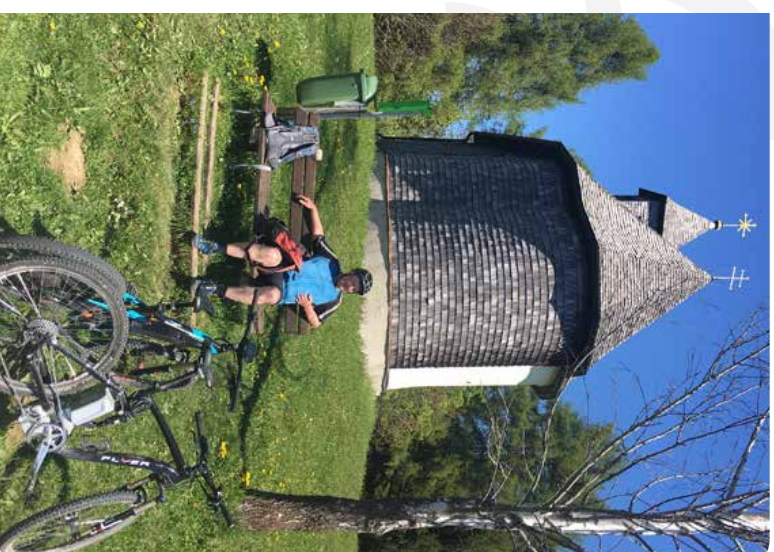
Auf der Kreuzgingln am Atersee