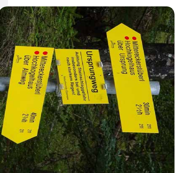
Die Naturfreunde Ebensee Wegweiser-Tafeln