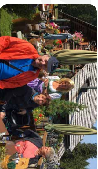
Auf der Rossalm zwischen Halstatt und Gosau