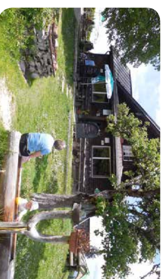
Am Hoismrad oberhalb von Bad Ischl